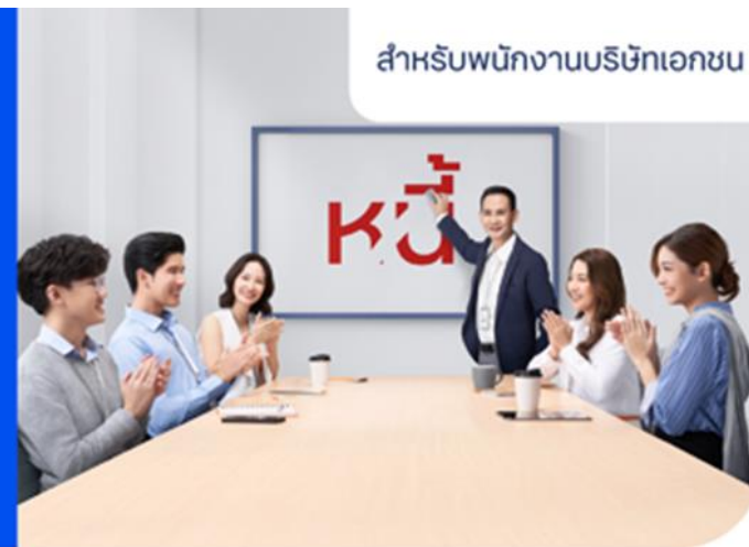
ตัวอย่าง เปรียบเทียบภาระหนี้ ก่อนและหลังรวมหนี้กับสินเชื่อสวัสดิการอเนกประสงค์ ทีทีบี (บาท)