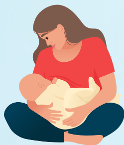
คลอดบุตร