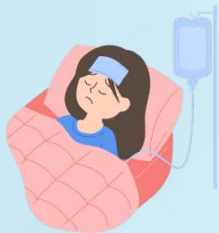
ประสบอันตราย หรือ เจ็บป่วย