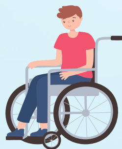
ทุพพลภาพ