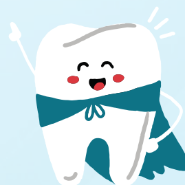
ทันตกรรม