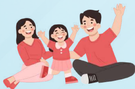
สงเคราะห์บุตร